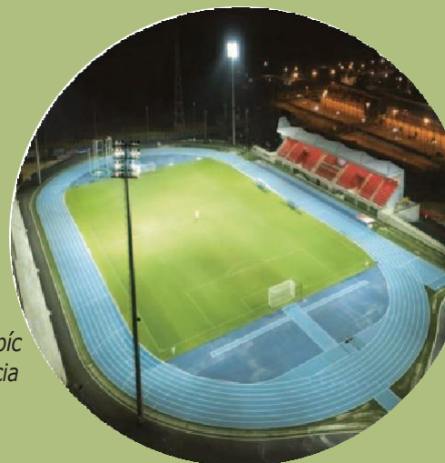
Estadi Olímpic Camilo - La Nucia

As grandes finais dos quatro torneios de futebol 11 terão lugar no Estadio Municipal Guillermo Amor no dia 16 de maio de 2026.