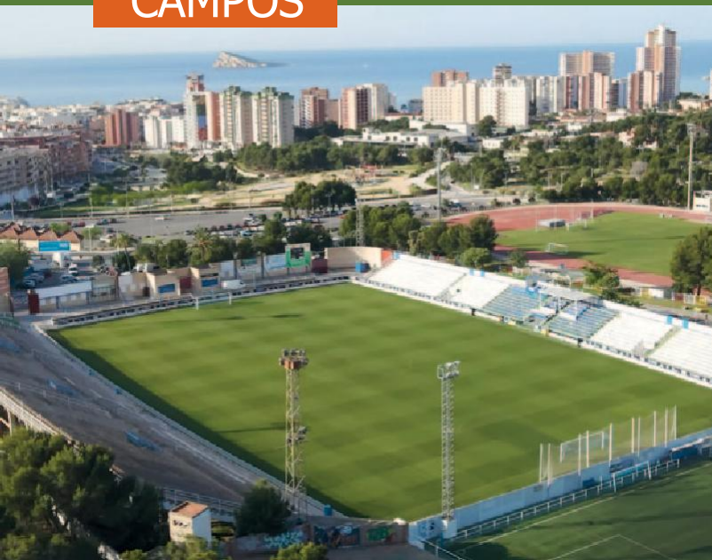
Estadio Municipal Guillermo Amor - Benidorm

Os jogos do 22º Mundivocat serão realizados nos municípios de Benidorm (6 campos), La Nucía (3 campos) e nas localidades vizinhas de La Vila Joiosa , L'Alfàs del Pi , Altea e L'Albir .