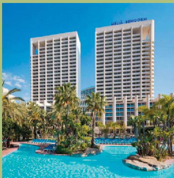
▲ Meliá Benidorm